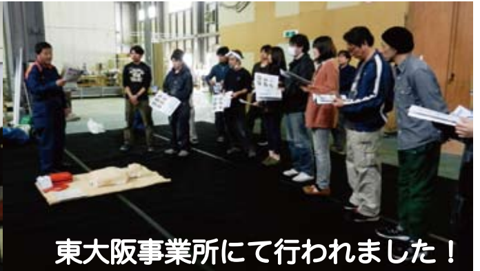
東大阪事業所にて行われました！

4月16日に東大阪事業所でAED講習会が行われました。今回で4回目(大阪)となります。人命に関わる緊急事態に遭遇した時、救急車が到着するまでの間に適切な対応がとれる様、人工呼吸や胸骨圧迫などの心肺蘇生を行うことはとても大切なことです。助かる命を助けるために、日ごろから正しい応手当を身につけられるよう、東大阪市消防局の方からご指導をいただきました。