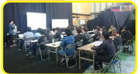
▲受講者は21名。東大阪倉庫にて。

行政施設・大規模な商業施設など、至るところに設置されています。この10年間で急速に普及したAEDを一般的に使用できるようになったのは2004年からです。しかし、本当に身近な場所には設置されていないのが現状です。設置されていることがわかってももしもの時に使用することができなければ意味がありません。定期的に講習を受けることで、現場に遭遇した場合に、できるだけ冷静に対応できるようにしておきたいものです。