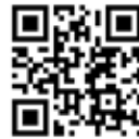
△『仮設工業会』のHPはこちらから飛べます！

その中でも、弊社にとって関わりの深い内容だったのが『仮設工業会』の展示です。仮設工業会は、主に建設工業用仮設構造物およびその構成機材についての必要な構造基準、使用基準等の設定および周知並びにこれらの試験、技術的指導等により、仮設構造物等に係わる労働災害防止とその工事施工の円滑化に寄与することを目的として設立されました。よく私たちが現場で