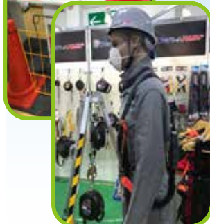
△安全に関する様々な製品