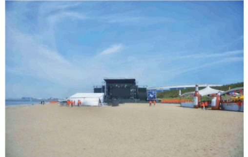
6/1-2 毎年海沿いで開催している現場。完成してみると夏を感じさせる、良いステージとなりました。