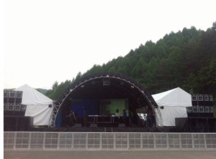
仕込み時は天候が悪く作業にも注意して取り組みました。おかげで本番日は快晴。最高でした。