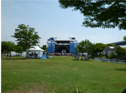
5/25-26で開催 3ステージのうちの一つ。新しい場所での開催で、入念な下見を繰り返しました。

今年も野外現場の時期がやってきました。夏に先駆けて5月末/6月頭でいくつかの現場を紹介します。どれも大きな事故無く終えることができました。まだまだ夏本番はこれからですが良いスタートを切れたのではないのでしょうか。