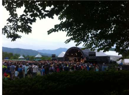
6/1-2 毎年長野で開催している現場。毎回やっているのですが、油断せず、慣れをなくす努力をしました。