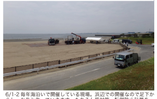
6/1-2 毎年海沿いで開催している現場。浜辺での開催なので足下からしっかりと作っていきます。もちろん風対策、転倒防止計算を入念にしています。