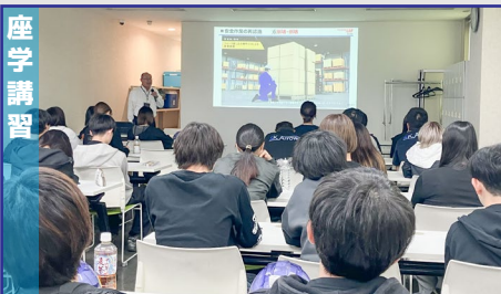
基礎知識の確認及び危険作業の対策

10月14日(火)にURAYASU舞STUDIOにてフォークリフト講習会を開催しました。 TOYOTA L&F東京株式会社様をお招きし、午前と午後の2部構成で行いました。 午前の部では、フォークリフト作業におけるマクロな観点に対して、 午後の部では、我々の業界に絞ったミクロの観点でフォークリフトの安全を考えることができました。