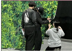
▲状態を確認し、必要であれば補修を行う