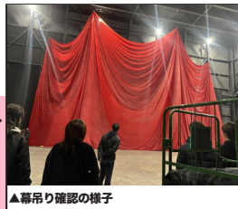
▲幕吊り確認の様子

社内で保管している幕の状態や仕様を把握するため、定期的に有り物幕の確認作業を実施しています。作業は保管を担当する資材管理課も加わった2チーム体制で行い、約80枚を確認しました。