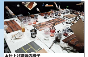
▲仕上げ講習の様子