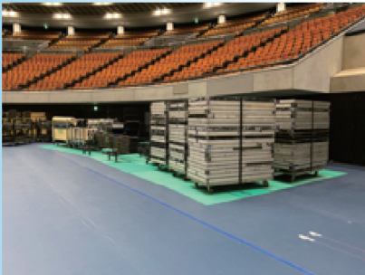
▲資材ため場には必ず養生材を。