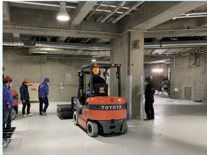
▲フォーク作業は慎重をお願いします。