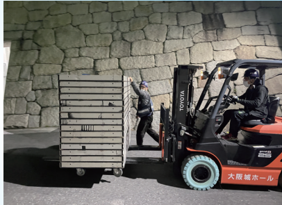
▲死角のための補助をお願いします。