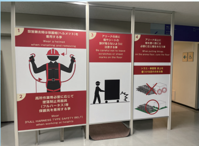
▲ひとつひとつご確認ください。