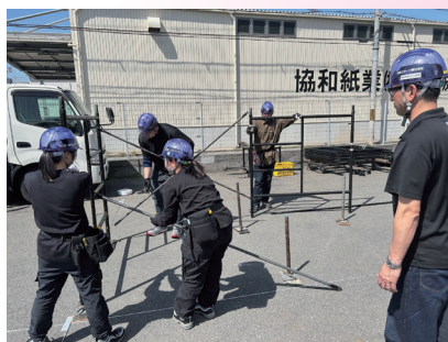
△イントレ部材を使って足場を組む実技です。ひとつひとつ丁寧に学び、体に叩き込みます。

4月1日舞スタジオにて弊社の入社式が執り行われました。今年の新入社員は36名。東京32名、大阪4名です。これから様々な研修を通じて社会人としての立ち居振る舞い専門知識を身につけて、各部署への配属となります。新しい弊社の仲間たちを、どうぞ宜しくお願いいたします。