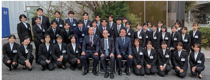
△舞浜スタジオの桜の前にて恒例の記念撮影。