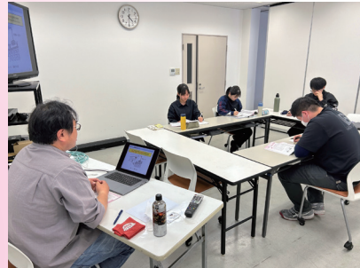
△「足場組立特別教育」の座学時間のひとコマ。しっかり頭に知識を入れたあと、実技に入ります。

入社式を終えて、新人研修が始まります。大阪では本社にて営業、デザイン、設計監理の座学研修を受講し、東大阪事業所では、現場に向けた「足場組立特別組立教育」「フルハーネス特別教育」を2日間、しっかり受講しました。見るもの触れるもの、全てがはじめて